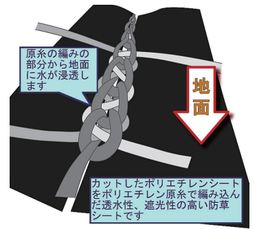
ネガ・ツールの特徴

しかし、対象企業群は製品に強い関心を示しながらも、公共工事で使用する際の資材性能計算等の手間から、性能計算等が不要である国の認証済み資材を使用したいというニーズが強く、販路開拓は思うように進みませんでした。