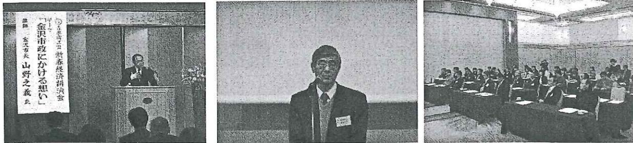
左：山野金沢市長講演風景