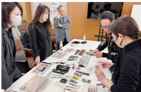
個別相談会の様子

大都市圏等において新たな販路開拓を目指す参加事業者は、流通やデザインの専門家から、商品やパッケ