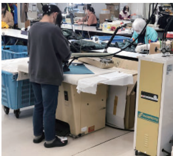
入替えた貫流式ボイラー (右端)

このため、経営上の課題として、①出産や育児、配偶者や両親の介護など、仕事と生活の両立に向けた職場環境の整備、②大幅な最低賃金引き上げと、社会保険の加入を望まない従業員の労働時間短縮に伴う生産性の向上が挙げられています。