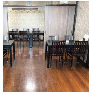
座敷からイス席に一新した店内

まずは地震で傷んでいた飲食店の小上がりの改修に取りかかりました。従来の座敷から現代のニーズに合わせたイス席へと一新し、ご家族や小グループがゆったりとくつろげる、より快適な宴会空間へと生まれ変わらせたのです。