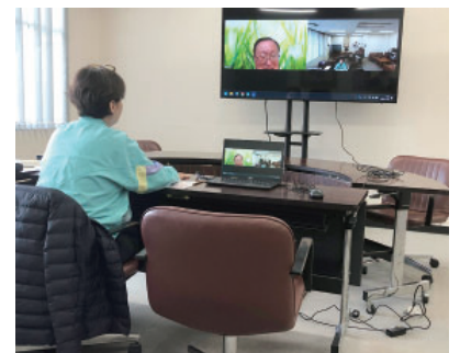
東京からのオンラインによる指導

大手損保系リスクマネジメント会社の専門家の指導により、一層実効性の高いBCPを策定することができました。